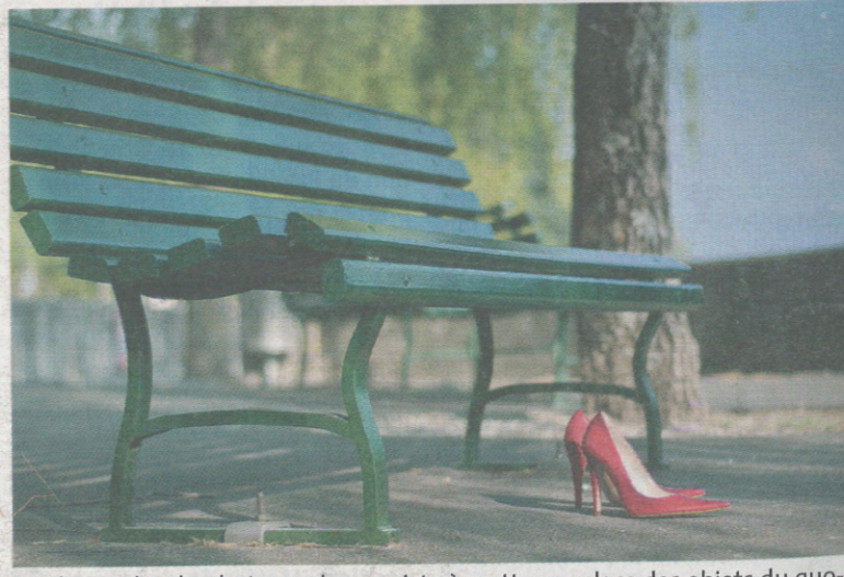
Un des credos du photographe consiste à mettre en place des objets du quotidien (lunettes, chaussures, colliers...) dans des milieux connus.